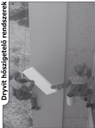
Dryvit hőszigetelő rendszerek